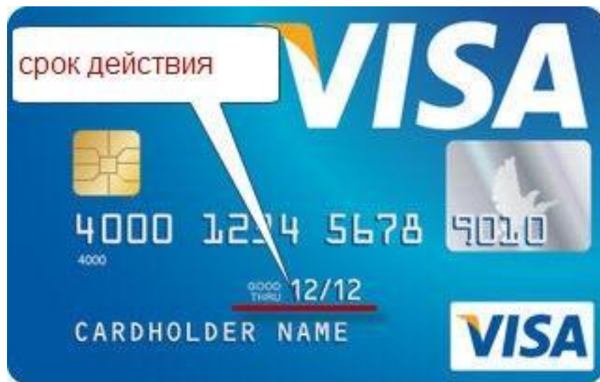
Рисунок 14. Срок действия платежной карты

Что такое CVV2-код? Это специальное число, состоящее из 3 цифр, которое обеспечивает дополнительную безопасность при транзакциях, при которых отсутствует сама карта, например, расчеты через интернет. Как правило CVV2-код написан на обороте карты (три цифры на полосе для подписи). Если на полосе для подписи больше трех цифр, Вы всегда вводите последние три цифры, первые цифры могут дублировать цифры номера платежной карты.