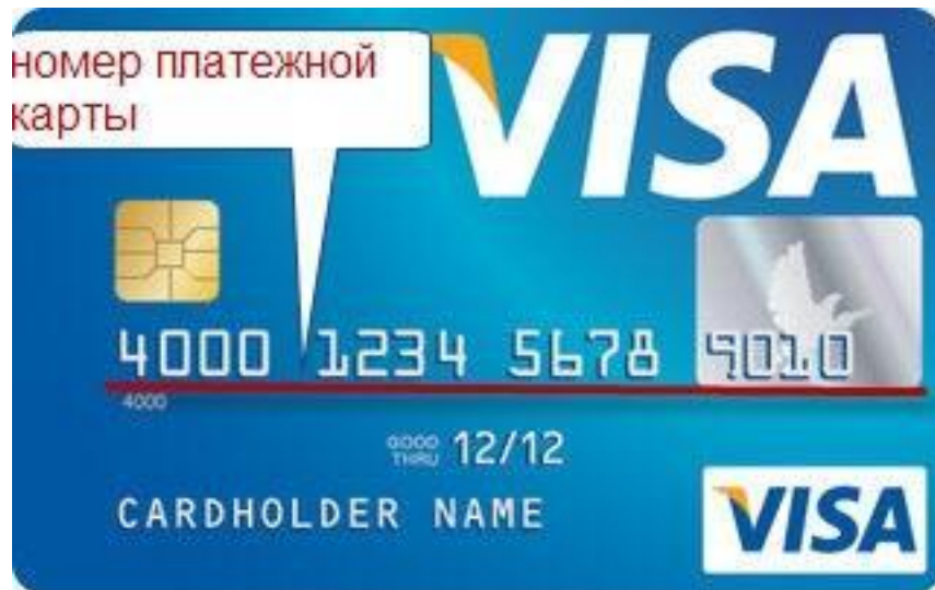
Рисунок 13. Номер платежной карты